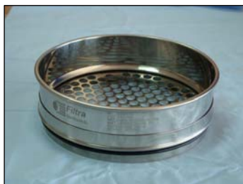
Tamices con chapa de perforación redonda