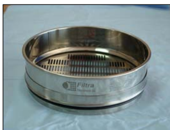
Tamices con chapa de perforación ovalada

⇒ Los tamices fabricados por FILTRÁ VIBRACIÓN, S.L. son acoplables entre sí y, además, pueden acoplarse a tamices de otros fabricantes.