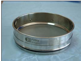
Tamices con tela metálica o malla

Los tamices de laboratorio Filtrá, tanto en malla de acero inoxidable como en chapa inoxidable perforada, redonda, cuadrada u ovalada, se fabrican cumpliendo rigurosamente con las normativas nacionales e internacionales UNE, ISO, ASTM, AFNOR, BS, etc.