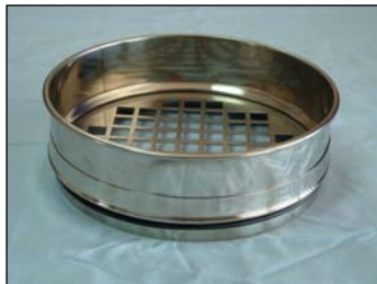
Tamices con chapa de perforación cuadrada