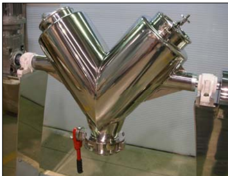
Cubeta en "V" en acero inoxidable