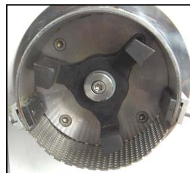
Martillo triturador con criba intercambiable.