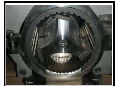
Cribas y cuchillas intercambiables del molino triturador.